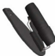
HandsFree ™ Speech Aid Holder