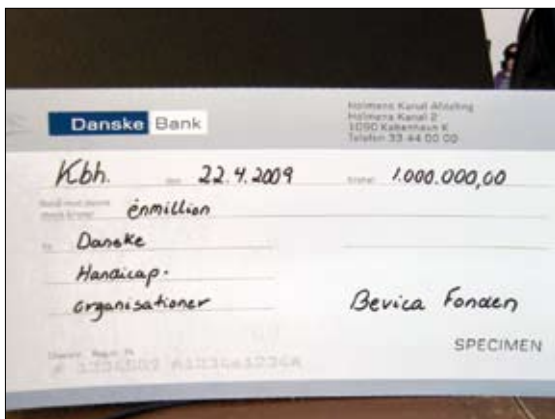
Sådan ser en stor check ud.

På den efterfølgende reception talte indenrigs- og socialminister Karen Ellemann. Hun glædede sig til samarbejdet, og meddelte, at regeringen havde valgt at fremsætte beslutningsforslaget om ratifikation af handicapkonventionen på DH's fødselsdag - den 23. april.