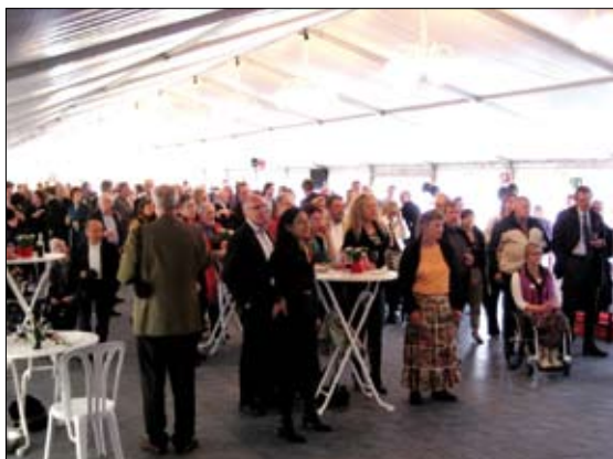
Fra receptionsteltet foran Den Sorte Diamant.

På den efterfølgende reception talte indenrigs- og socialminister Karen Ellemann. Hun glædede sig til samarbejdet, og meddelte, at regeringen havde valgt at fremsætte beslutningsforslaget om ratifikation af handicapkonventionen på DH's fødselsdag - den 23. april.