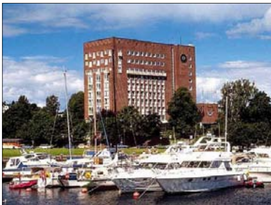
Rica Park Hotel i Sandefjord

Efter Årsmødet var der middag med en overvældende buffet, og her havde det været en fordel med en fast karakter.